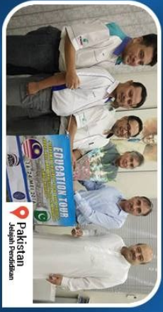
Pakistan Jajagi Pendidikan